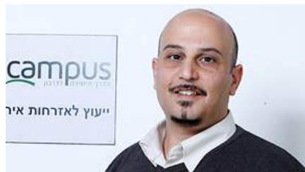
כסיף. "חלון ההזדמנויות קצר"

חשש נוסף הוא שהיד על הנפקת האישורים קלה מדי. "כשאני רואה יותר מדי דגלים אדומים אני לא נכנס לים", אומר גורם שמסייע בהשגת דרכונים אירופיים, "אני לא בטוח עד כמה בפורטו, למשל, בודקים לעומק את האישורים. בעבר פורטוגל כבר פסלה ויזות משקיעים שטופלו בידי פקיד מסוים וניתנו בצורה לא תקינה. זה עוד עלול להתפוצץ", הוא אומר.